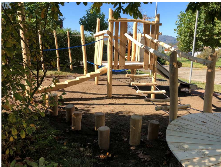
Individuell erstellt auf Ihr Budget und Ihre Platzverhältnisse.