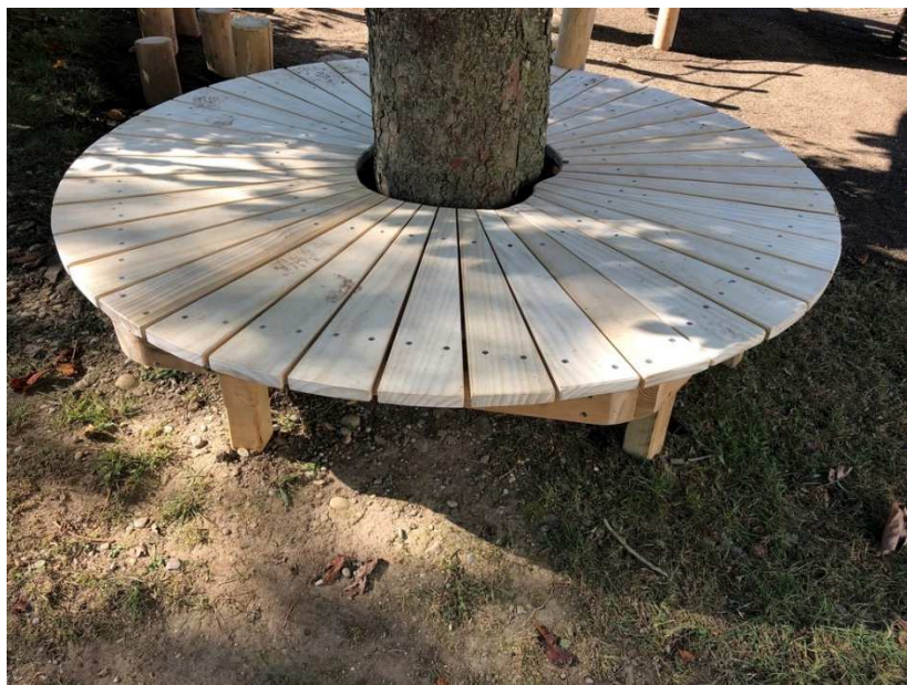
Baumplattform in edler Accoya, zum sitzen, verweilen für klein und gross.